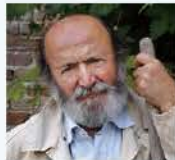
ジーノ・ジロロモーニ (1946~2012)

イタリア、ペーザロ・ウルビーノ県イゾラ・デル・ピアノーに生まれ、1970年~1980年にかけて、過疎に悩むイゾラ・デル・ピアノーの村長を務める。1974年にイゾラ・デル・ピアノー村で効率優先の現代農業のアンチテーゼとして有機農業を始める。1977年、仲間と有機農業協同組合を設立し、代表に就任。1986年、マルケ州有機農業者協会を共同で設立。1997年、地中海有機農業協会(AMAB)を設立。同協会には現在、1万3千の有機農業法人が加盟している。