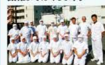
伍詰工場のみなさん

牛肉を塩(伯方の塩)・喜界島粗糖で2晩以上漬けた肉を蒸煮してから手作業で丁寧に繊維までほぐします。