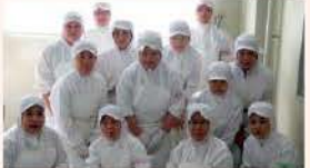
バンドラファームグループ工場のみなさん