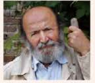
ジーノ・ジロロモーニ(1946～2012)

イタリア、ペーザロ・ウルビーノ県イゾラ・デル・ピアーノに生まれ、1970年～1980年にかけて、過疎に悩むイゾラ・デル・ピアーノの村長を務める。1974年にイゾラ・デル・ピアーノで効率優先の現代農業のアンチテーゼとして有機農業を始める。1977年、中間と有機農業協同組合を設立し、代表に就任。1986年、マルケ州有機農業者協会を共同で設立。1997年、地中海有機農業協会(AMAB)を設立。同協会には現在、1万3千の有機農業法人が加盟している。