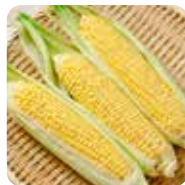
複合アミノペプチド

複合アミノペプチド×植物由来成分×穀物由来成分×ナノイオン水により、除菌抗菌・分解消臭の効果を発揮します。