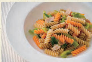
キャベツとベーコンのアンチョビパスタ