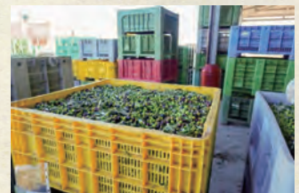
収穫され工場へ搬入されたオリーブ