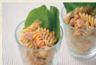
フジッリのカラフルサラダ

【原材料】有機デュラム小麦のセモリナ(イタリア)、有機トマトパウダー(イタリア)、有機ほうれん草パウダー(EU)