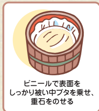
ビニールで表面をしっかりと被い中フタを乗せ、重石をのせる