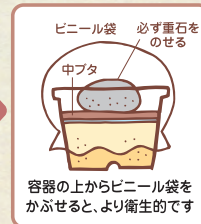
容器の上からビニール袋をかぶせると、より衛生的です