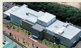
麴造りから混合までは、長崎県大村市にあります長工醤油味噌協同組合味噌工場(香味彩館 あじさいかん)にて行います。平成11年(1999)9月から稼働中の「香味彩館」は、HACCP対応設備をはじめ、新しい殺菌システム・独自の搬送システムなど、業界でも屈指の設備を誇る味噌工場です。