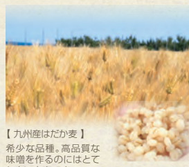
【九州産はだか麦】希少な品種。高品質な味噌を作るのにはとても良い大麦です。