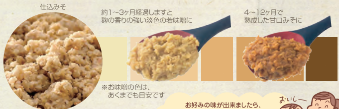
※お味噌の色は、あくまでも目安です

お好みの味が出来ましたら、冷蔵所に保管してください。発酵の期間で、わが家オリジナルのお味噌の味をお楽しみください。