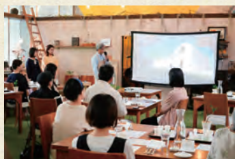
ジロロモーニ農協の解説