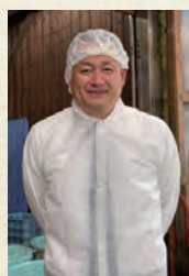
製造者 近江農産組合 高木専務理事

滋賀県の認証を受けた「環境こだわり農作物」をはじめ、安心の国産野菜を使用しています。新鮮な野菜の風味を活かした浅漬は、さっぱりとした味わいと心地よい食感が特徴です。近江農産の漬物は、素材の持ち味を大切に、健康的な食生活を支えることを目指して、ひとつひとつ丁寧に製造しています。