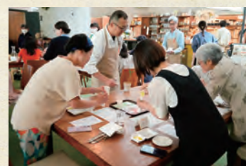
楽しく手作りドレッシング

ファンの皆様からは、お料理の満足感とともにジロロモーニブランドへのご理解をより深めていただくことになりました。