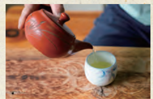
煎茶を淹れていただきました

70℃くらいのお湯で淹れるため、熱湯を一度湯呑に入れて少し冷まします。1分半~2分おいてから急須に注ぎます。最後の一滴が美味しいと伺いました。これからは最後の一滴まで大切に淹れようと決意しました。