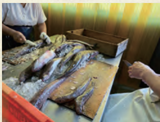
うろこ取り等の下処理