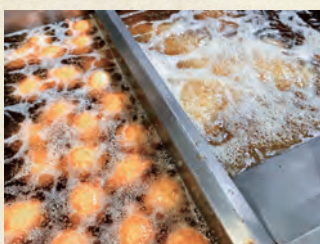
有機べに花油で揚げ

4種類混載30個以上にて製造元山口県より直送。本州、四国、九州は送料無料。北海道、沖縄、離島は送料800円(税抜)。