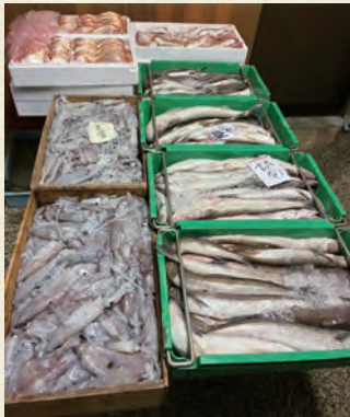
原料のエソ・レンコダイ・イカ