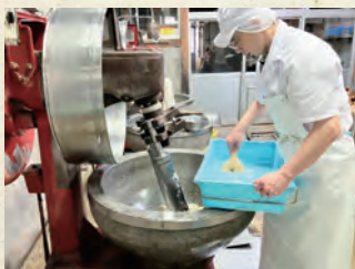
石臼で搗潰(らいかい)